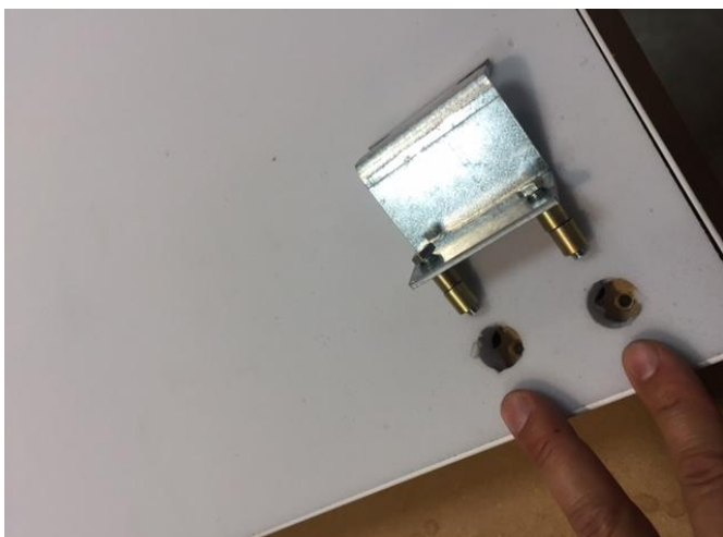
Les entretoises se positionnent sous l'équerre