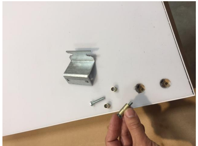
Chaque équerre est accompagnée de 2 vis + 4 entretoises