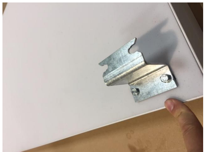
Les vis se serrent à l'aide d'une clef 6 pans