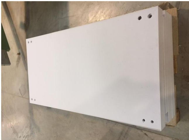
La face arrière de la baffle acoustique possède 8 perçages